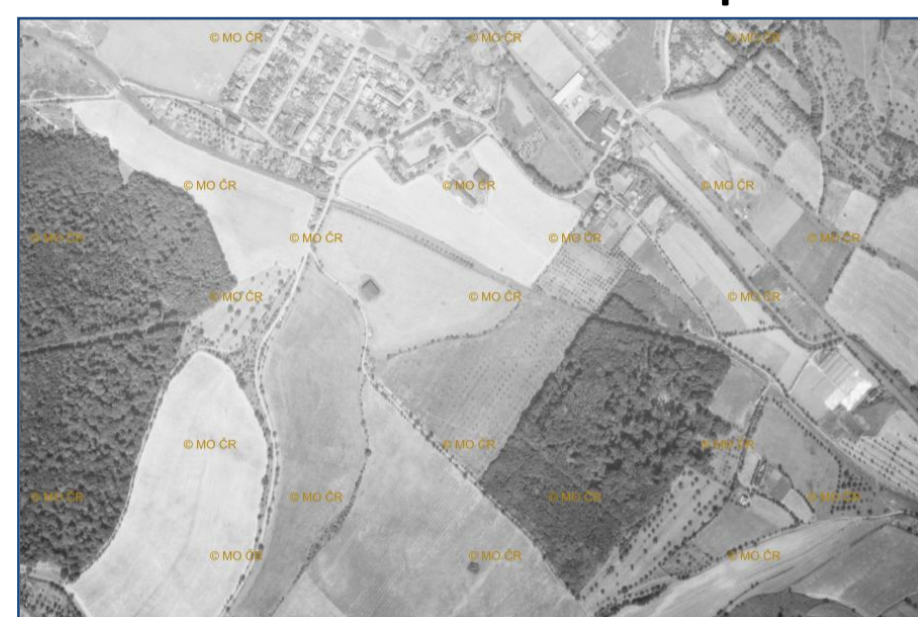
Letecký snímek 1946