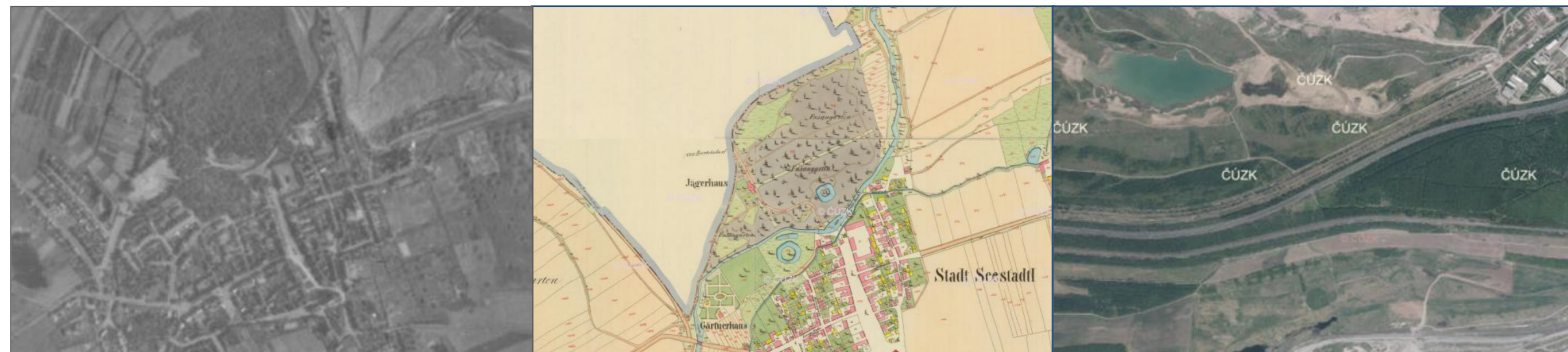
Letecký snímek 1938