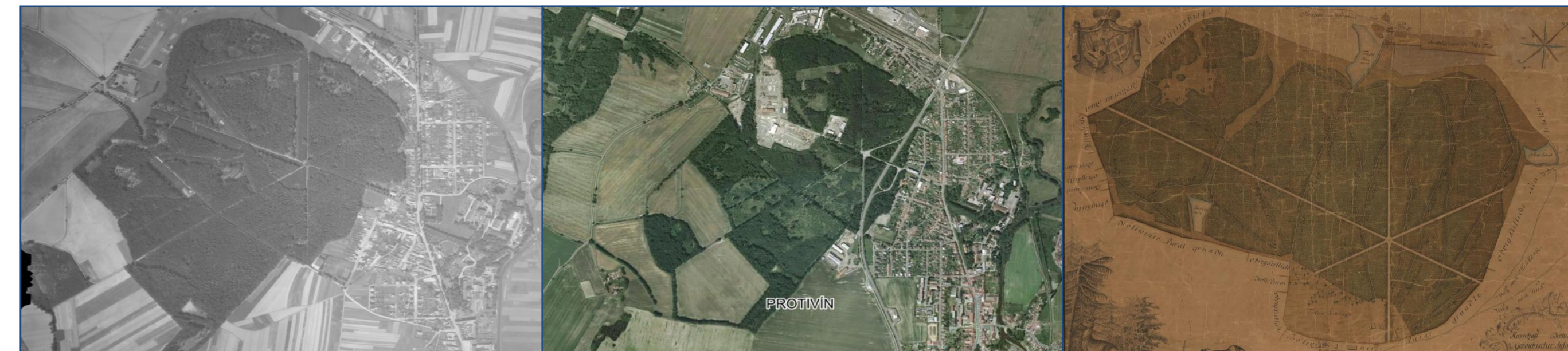
Letecký snímek 2015