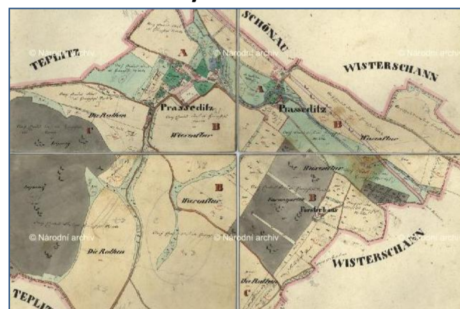
Indikační skica 1826 - 1830