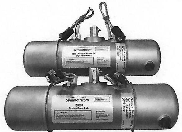
10890A/10891A tube for 5071A only